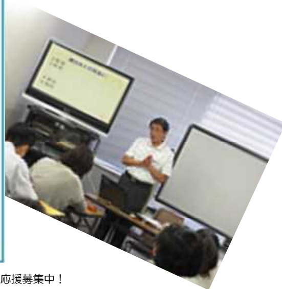
↑ころちゃんクリアファイル作成企画 応援募集中!